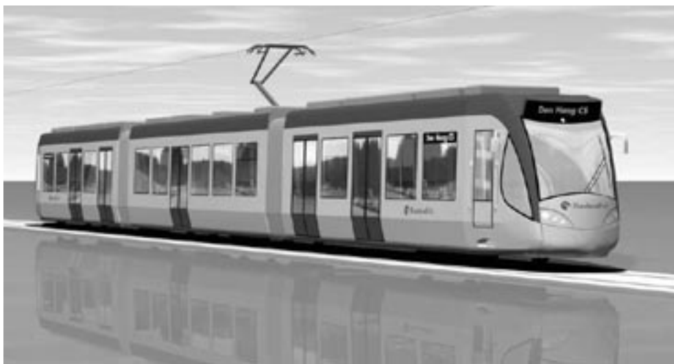
Figuur 1 De Haagse RandstadRail, voorbeeld van een RegioTram

Die tunnel is een onmisbare schakel voor de Haagse RandstadRail, een kruising tussen tram en trein (zie figuur 1). In 2006 vervangt die RandstadRail de sprinter op de Zoetermeerlijn en verzorgt directe verbindingen tussen Zoetermeer en Den Haag west. Daarbij maakt de RandstadRail gebruik van de voormalige infrastructuur van de Nederlandse Spoorwegen en van het huidige Haagse tramnet. Twee tramlijnen worden daartoe aangepast: lijn 3 en lijn 6. Een nieuw viaduct via de Beatrixlaan verbindt beide netten. Twee jaar na de vervanging van de sprinter op de Zoetermeerlijn volgt de ingebruikname van de Rotterdamse variant van de RandstadRail. Deze vervangt in 2008 de sprinter op de Hofpleinlijn. De Hofpleinlijn wordt door middel van een boortunnel verbonden met de Erasmuslijn. De Rotterdamse variant van de RandstadRail is geen kruising tussen tram en trein zoals de Haagse RandstadRail maar een metro die gebruik maakt van een voormalige spoorweg. De Haagse en de Rotterdamse variant van de RandstadRail verschillen dan ook in technisch opzicht van elkaar (zie tabel 1). Dagelijkse gebruikers zullen dit vooral merken in het verschil tussen de lage vloer van de Haagse RandstadRail en de hoge vloer van de Rotterdamse RandstadRail. Op het traject tussen Leidschenvveen en Den Haag